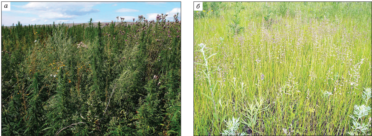
Рис. 1. Сорная растительность пионерной стадии (а) и злаковая – простой (б) на отвале с ПСП на постоянной ПП. Второй (а) и девятый (б) годы после формирования отвала.

и наступает простая, монодоминантная стадия сингенеза (рис. 1). Формирование этой стадии сопровождается накоплением большого количества корневищ в верхней части подземного слоя и ветоши в надземном, что биоценотически препятствует формированию мозаичного фитоценоза. Только на колониях узкочерепной полевки, которая разрыхляет ПСП на глубину до 50 см и минерализует поверхность, создаются благоприятные условия для сохранения фрагментов сорной растительности. Выжигание на стадии перехода сорной растительности в злаковую не оказывает влияния на скорость стадийной смены фитоценозов.